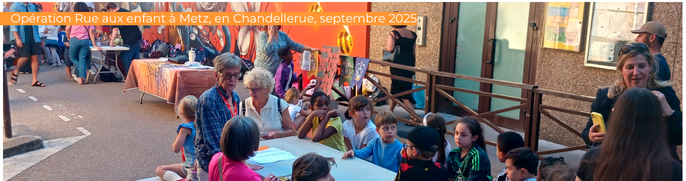
Opération Rue aux enfants à Metz, en Chandellerue, septembre 2025.