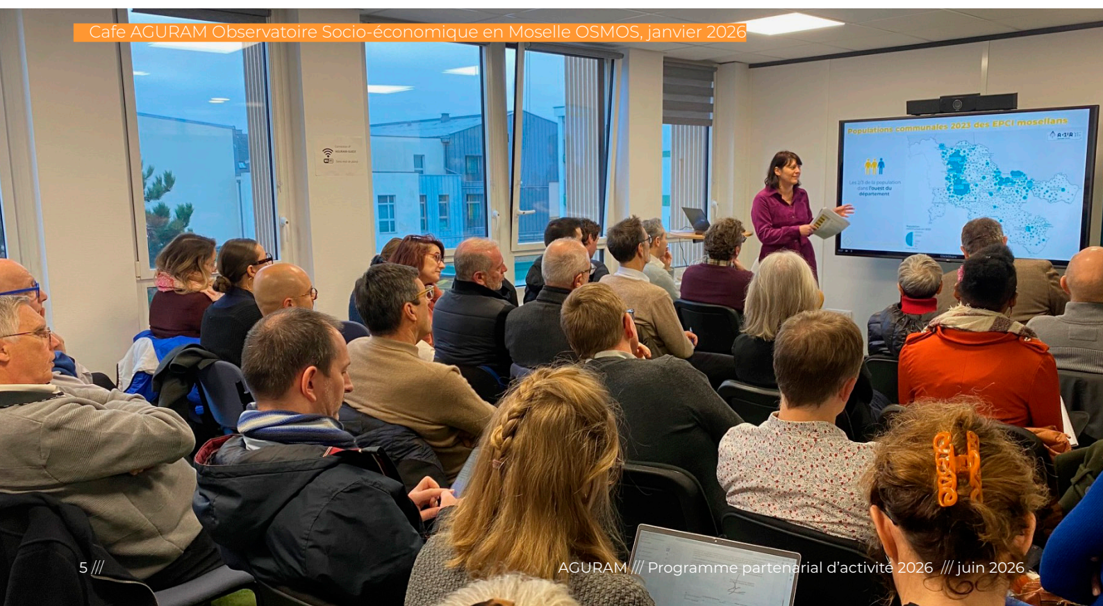
Café AGURAM Observatoire Socio-économique en Moselle OSMOS, janvier 2026

L'agence réalise 2 publications socles : le Carnet d'actualité , revue de veille territoriale et technique, et l' Observatoire socio-économique en Moselle (Osmos) pour lequel 2026 sera la 2e année d'existence.