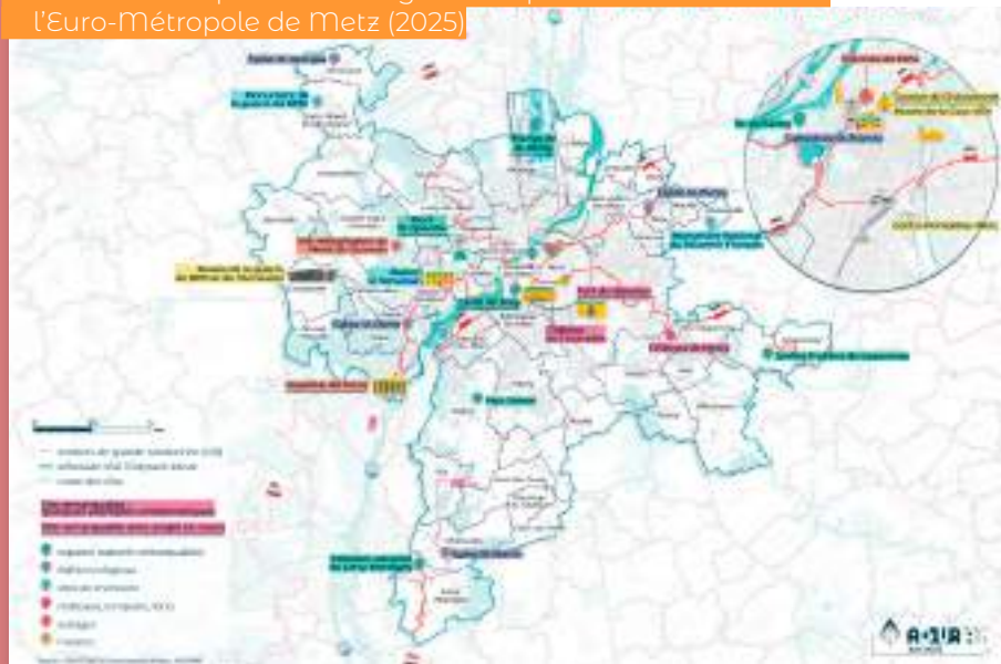
Carte réalisée pour la Stratégie métropolitaine 2030-2050 de l'Euro-Métropole de Metz (2025)