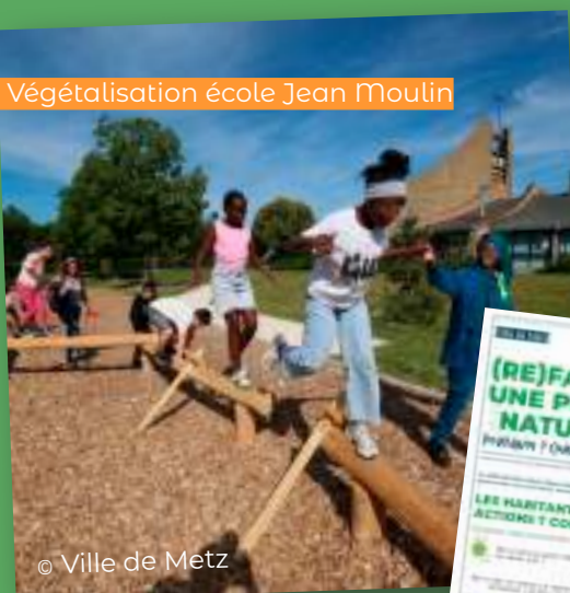
Végétalisation école Jean Moulin

L'AGURAM accompagne ses partenaires dans l'intégration de ces enjeux environnementaux dans la planification et les projets.