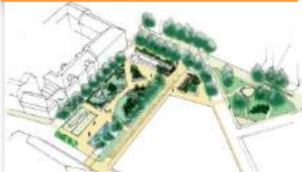
Dessin des changements d'usages et partage de l'espace public - place saint Thiébault, Metz